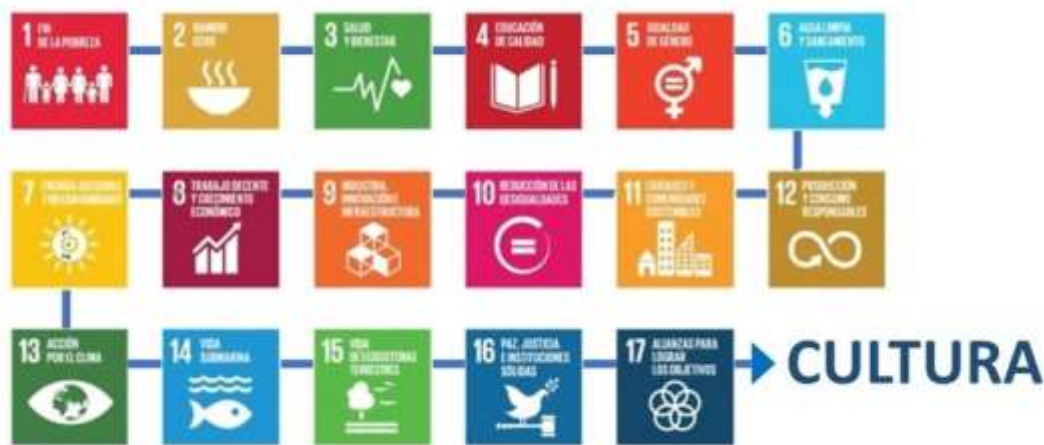
Figura 1: Los ODS caminan hacia la cultura como un aspecto fundamental.

La meta 11.4 subraya la necesidad de redoblar los esfuerzos para proteger y salvaguardar el patrimonio cultural y natural del mundo, en el marco del Objetivo 11, relativo a lograr que las ciudades y los asentamientos humanos sean inclusivos, seguros, resilientes y sostenibles.