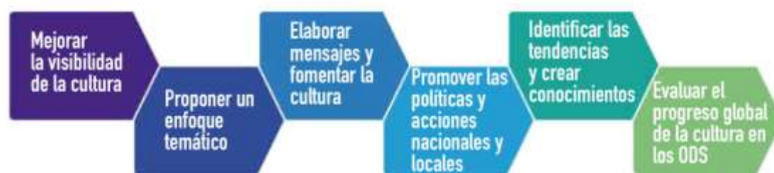
Figura 3: Fundamentos de los indicadores de la Cultura (Fuente: Organización de las Naciones Unidas para la Educación, la Ciencia y la Cultura, 2020).

dinamismo y la relación de la misma con aspectos necesarios o prioridades (pobreza, hambre, salud, etc.); la consonancia de la redacción del texto de los ODS con aspectos más económicos que culturales; no se considera la cultura con su contribución al Producto Interior Bruto, siendo vinculante con el desarrollo humano, la sociabilidad, la convivencia y la cohesión social; la relación de la dimensión cultural con el tratamiento de tensiones nacionalistas o populistas frente al diálogo, el diálogo y la comprensión; la dependencia de la sostenibilidad con los aspectos del medio ambiente, que considera la cultura como una tradición alejada de la realidad; la cultura se relaciona con un tipo de cultura más elitista que popular, por lo que no se considera una prioridad, o al alcance de unos pocos; la cultura aporta directamente al desarrollo, lo que no se muestra claramente en numerosos estudios; y por último, la cultura aparece desdibujada en otros sectores (turismo, artesanía, folklore, etc.) sin vinculación con las identidades y la vida cultural de las personas (Figura 3).