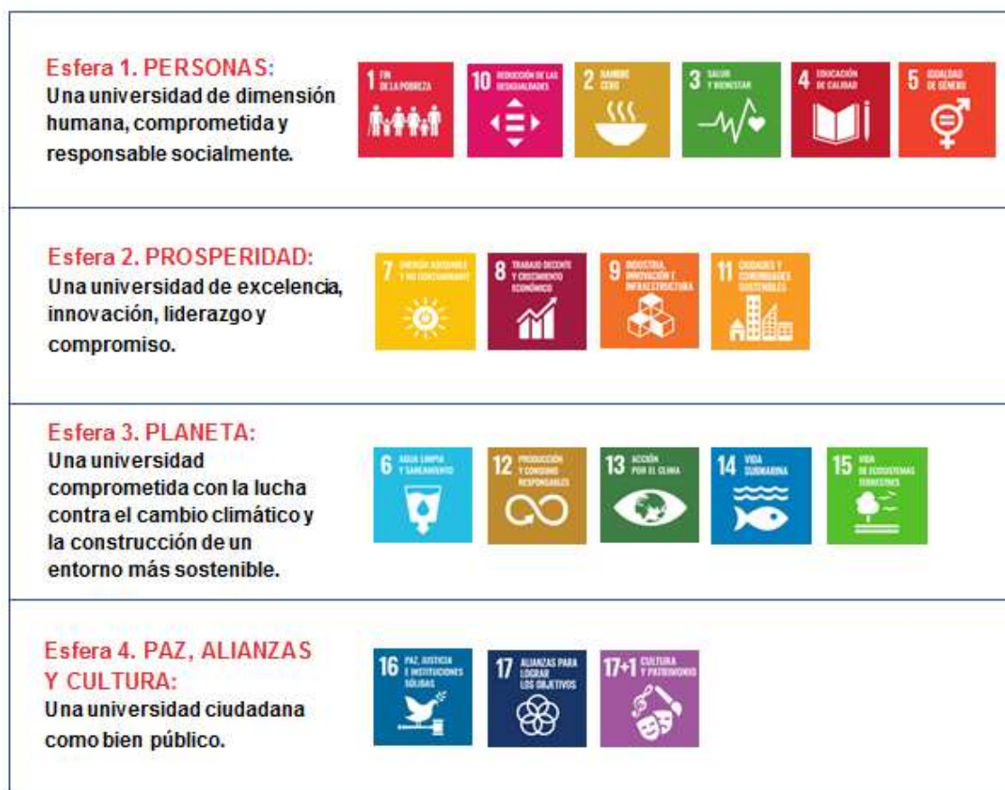
Figura 6: Propuesta del ODS 17+1 que vincula Cultura y Alianzas (Fuente: Universidad de Granada, 2021).