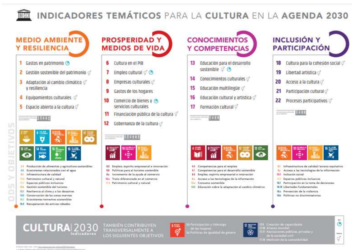
Figura 4: Aspectos de la Cultura en la Agenda 2030.