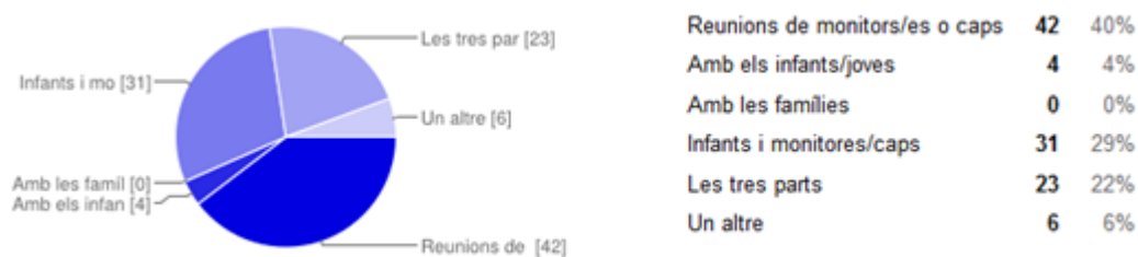
Gràfic 7. Com avalueu la vostra tasca i els objectius marcats?

La majoria dels enquestats sempre o quasi sempre preparen activitats en relació a uns objectius educatius. Al gràfic 7, s'observa que el 40% de les persones avaluen aquests objectius i la tasca a través de les reunions de l'equip educatiu. Quasi un 30% ho fan tant amb l'equip com amb els infants i un 22% també inclouen a les famílies en el seu sistema d'avaluació.