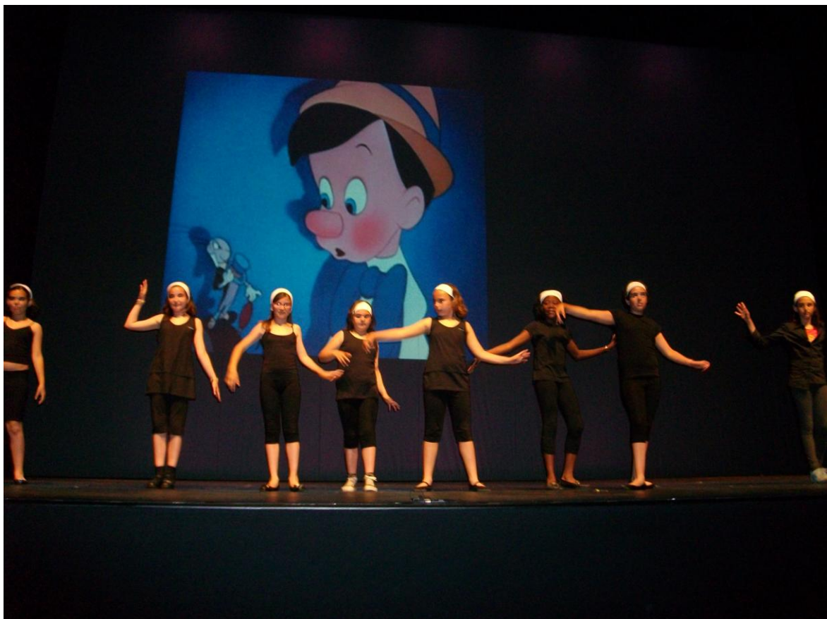
Actuación en el Paraním de la UJI. 23 de abril de 2010. Obra de teatro: “La voz de la conciencia” XXIV “Mostra de Teatre Escolar” (CEFIRE de Castellón)

La introducción de la música en las obras, también ha permitido que los alumnos que presentan dificultades de movimiento, se estimulen y motiven para hacerlo.